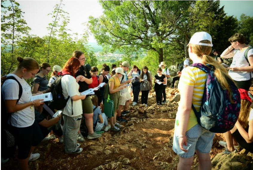
Imádság a Jelenések hegyén