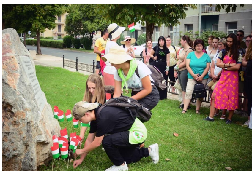
Magyar zászlók elhelyezése az emlékműnél

Szállást, étkezést, és a közösségi programokhoz helyet a mosztári Egyetemi Központ biztosított számunkra. Mosztárban előadást hallgattunk Csontváry Kosztka Tivadarról, aki 1903 tavaszán Boszniában és Hercegovinában járt, és több festményén is megörökítette az itteni táj szépségét. A városnézés során nemzeti színű zászlókat helyeztünk el a mostari Öreg-híd újjáépítésében résztvevő magyar katonák emlékművénél, és megcsodálták az Öreg hidat.