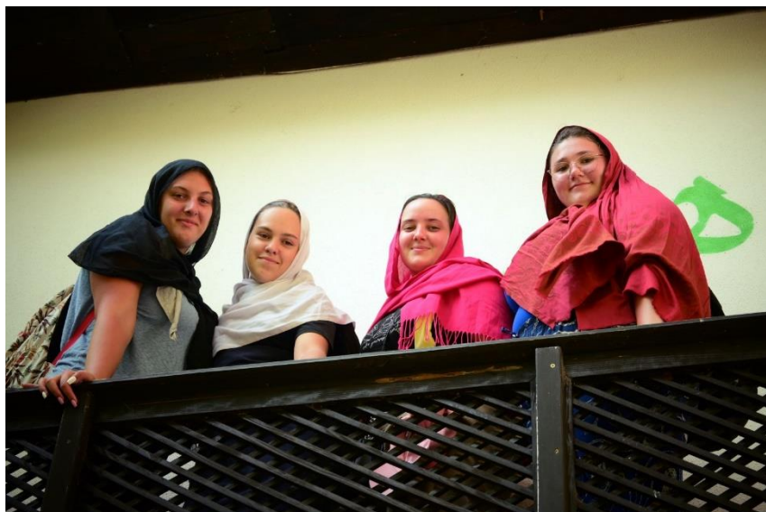
A középkori dervis kolostorban

A tábor idejének jelentős részét Međugorjében töltöttük, ahol részt vettünk a 35. Nemzetközi Ifjúsági Imafesztivál egyes rendezvényein, mint például a szentmisén, a Szűzanya szobrával tartott körmeneten, a szentségimádáson és az imádságon a Jelenések hegyén.