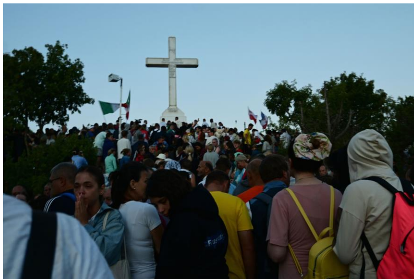
Hajnali szentmise a Križevacon

Az itt töltött napok zárásaként, az utolsó éjszaka felmáztunk a Križevac hegyre, ahol részt vettünk a hajnali 5 órakor kezdődő szentmisén.