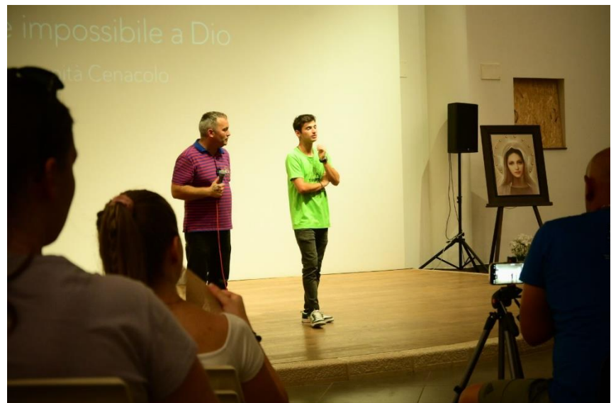
A Cenacolo közösség két tagjának tanúságtétele