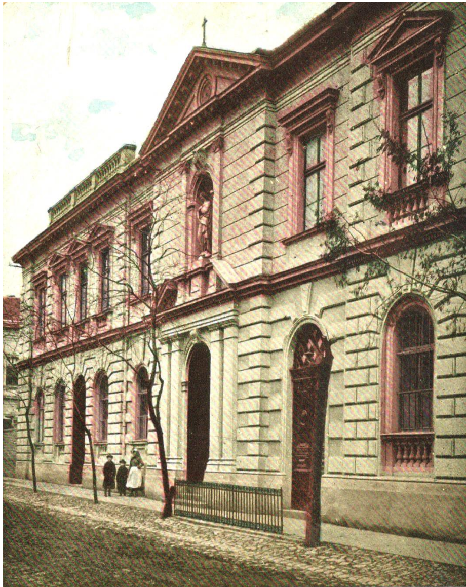
Rom. kat. Zarda. Röm. kat. Kloster.

23 bennlakó növendéke volt az intézetnek. Az évek múltával az intézet fejlődött, terebélyesedett, s növekedett a tanulók száma is. Idővel nemcsak a tanítónők számát kellett világiakkal szaporítani, hanem az épületeket is bővíteni. Erre 1898 nyarán került sor, amikor is felszentelték a bővített épületet.