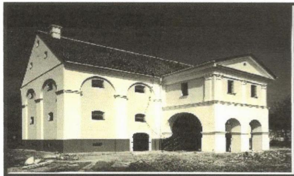
A kiszombori Rónay-kúria és a magtár