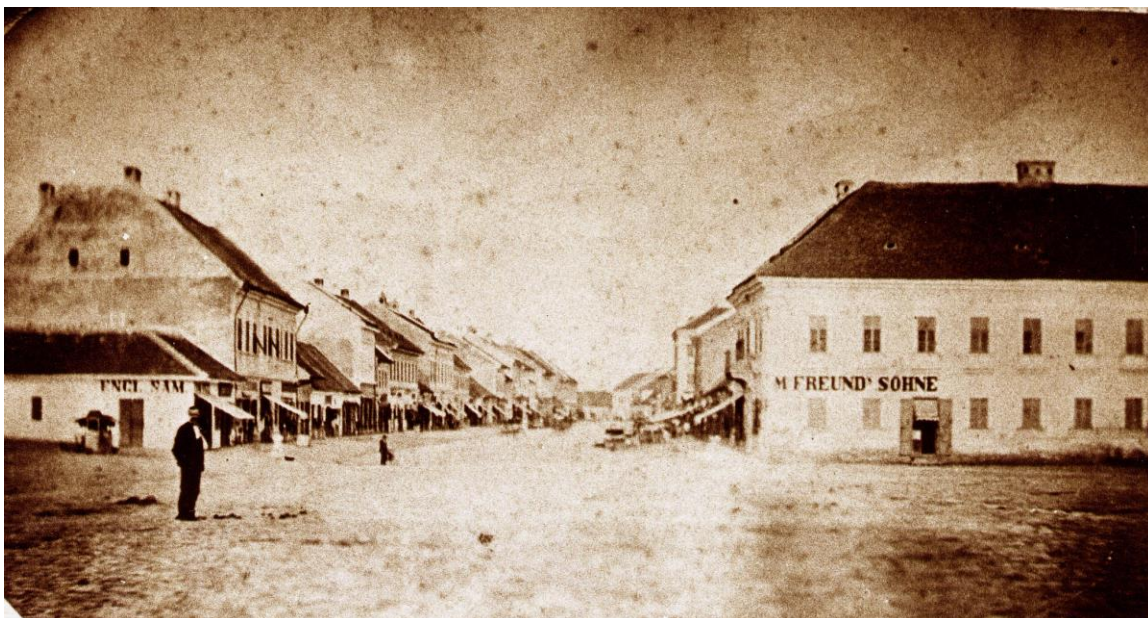
Nagybecskerek az 1870-es években